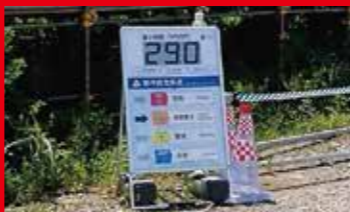
WBGT显示面板 发布湿球黑球温度指数(WBGT)信息