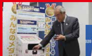
利用城市矿山制作！ 大家的奖牌项目

以改变国民对可持续发展的意识和生活为目标，采用了再循环金属、再循环塑料，有效利用了氢等。