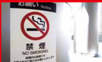
被动抽烟预防对策